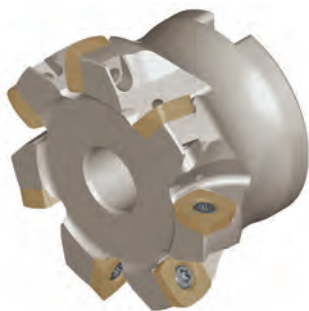
Aufsteckfräser 90° / SD.. 10 / INCH Face milling cutter 90° / SD.. 10 / INCH